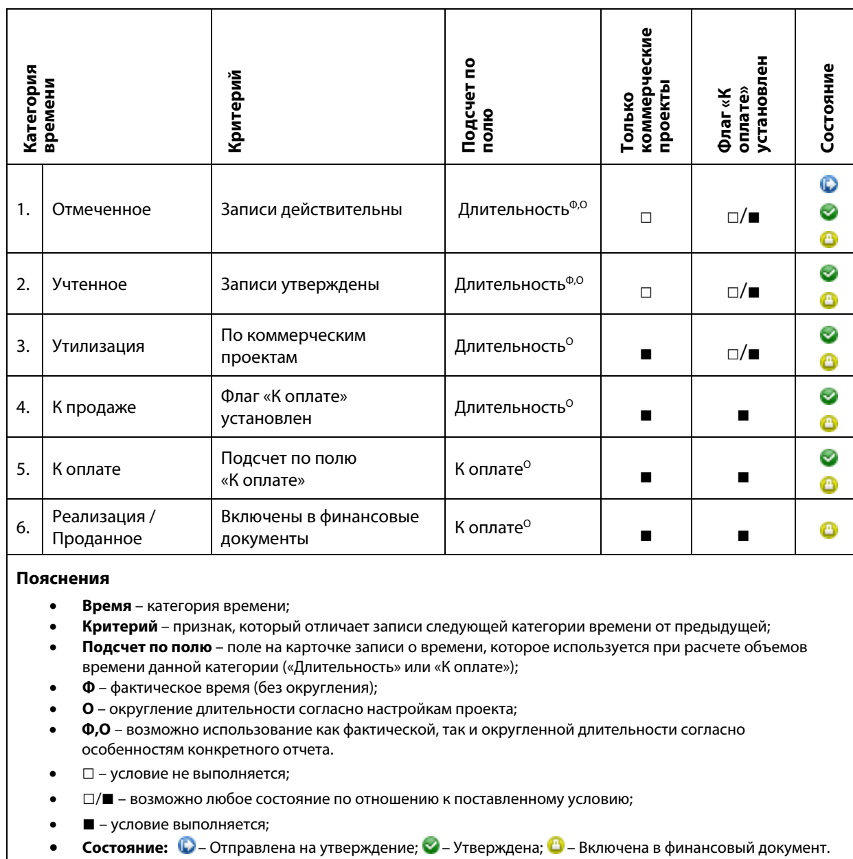
Таблица. Воронка реализации времени

Таблица ниже резюмирует приведенные выше описания категорий времени. Обратите внимание на столбец «Критерий», отображающий наиболее существенное отличие записей в текущей категории от записей в предыдущей категории.